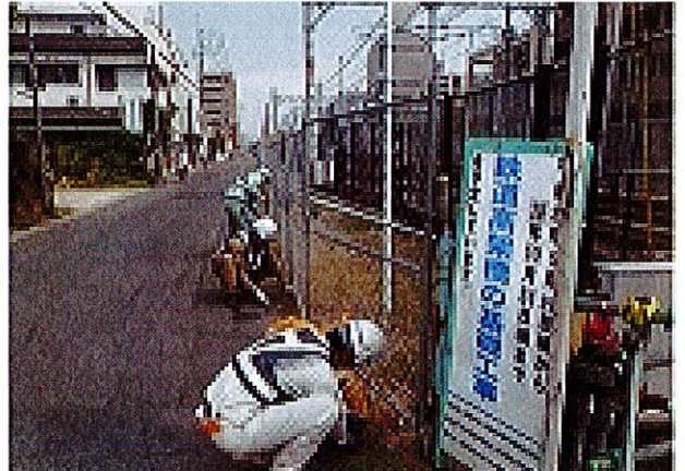
[西鉄白木原現場周辺清掃]