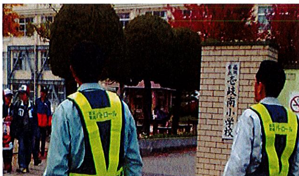
[堺南小学校付近パトロール]