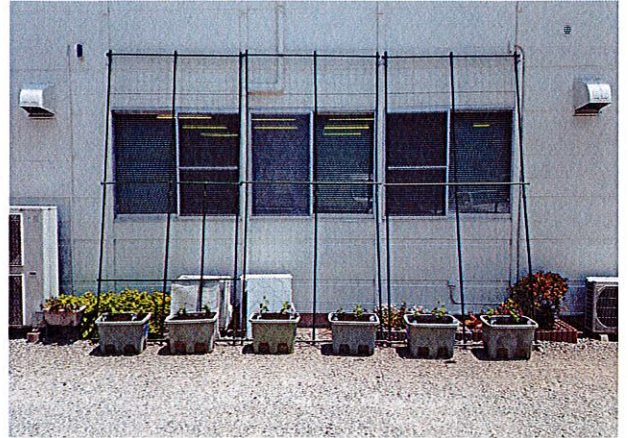
[本社グリーンカーテン]