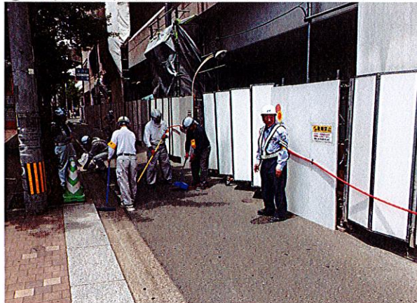
[西鉄耐震現場周辺清掃]